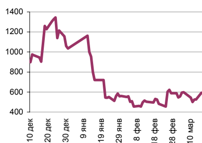
Ликвидные активы банков в ЦБ, млрд. руб.